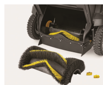
Cepillo principal trasero