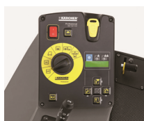
Sistema KIK (Kärcher Intelligent Key)