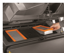
Sistema de limpieza automática de filtro TACT