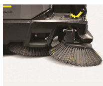
Posibilidad de segundo cepillo lateral media luna