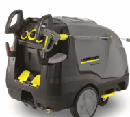
Enrollador para manguera (versión X)