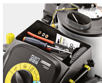
Almacenaje de accesorios