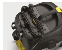
Ganchos de almacenaje para cable