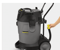
Manguera de desagüe incorporada