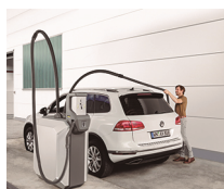
Disp. de recuperación de manguera con varilla de fibra de vidrio