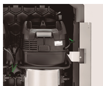
Turbina Ec larga vida útil