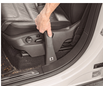
Boquilla aspiradora optimizada