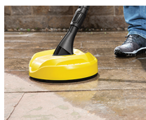
Accesorio para superficies T 150