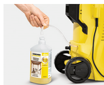
Con un dispositivo tubular, se puede aspirar detergente