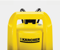
Cómoda asa de transporte