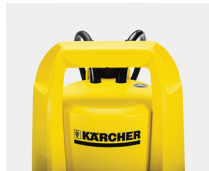
Cómoda asa de transporte