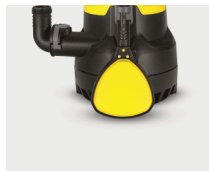
Con interruptor de boya