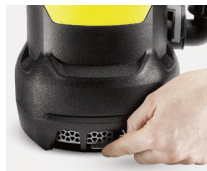
El filtro de acero protege la bomba de la suciedad gruesa