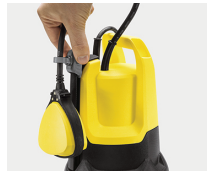
Innovador soporte y fijación de boya