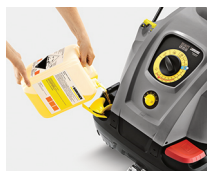
Fácil manipulado y uso