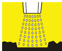
Aumenta un 40% la presión de impacto