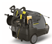
Enrollador para manguera (versión X)