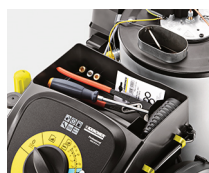
Almacenaje de accesorios