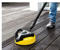
Accesorio para superficies T 350