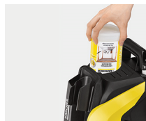
Plug 'n' Clean, cambio de detergente de forma rápida y cómoda