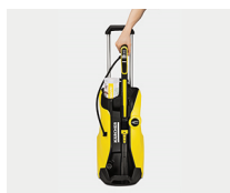
Posición de estacionamiento accesorios