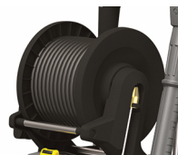
Enrollador para manguera (versión X)