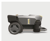
Uso vertical u horizontal